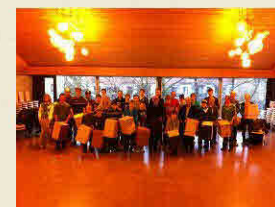
Cajon das Gruppenerlebnis