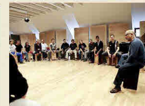
Cajon die „Kiste“ mit unglaublichen Möglichkeiten