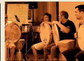
Faszination für ein unaltes Instrument