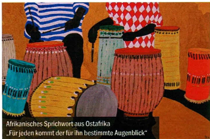
Afrikanisches Sprichwort aus Ostafrika „Für jeden kommt der für ihn bestimmte Augenblick“

am Freitag, den 29.06.2012 ab 17.00 Uhr Eintritt frei